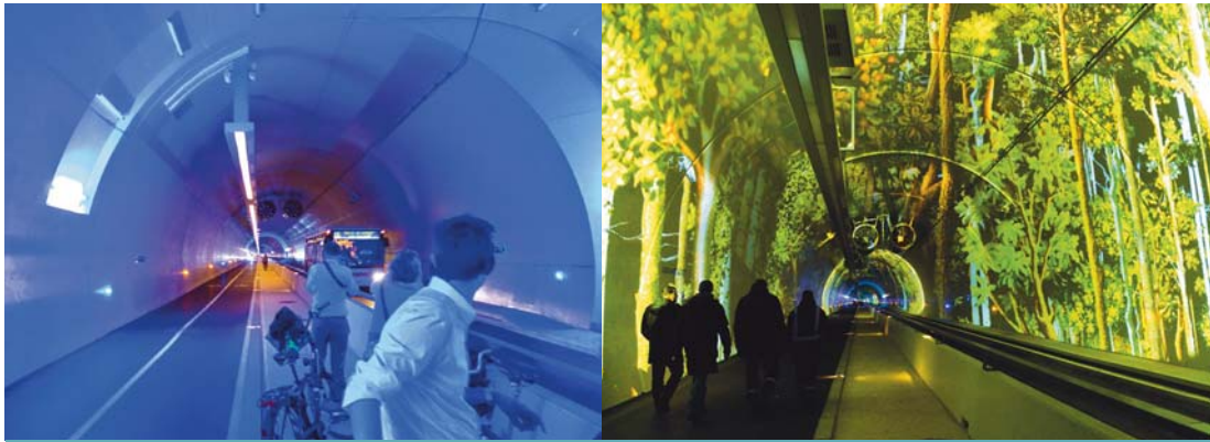
La délégation norvégienne découvre le tunnel modes doux

Suite à une visite d'une délégation norvégienne en terre lyonnaise, la ville de Bergen a annoncé au début de l'été la construction d'un tunnel modes doux inspiré de celui de la Croix-Rousse. Retour sur les raisons d'un succès essaimant au-delà de nos frontières.