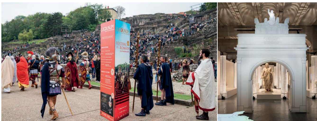
Bataille romaine et exposition «EnQuête de pouvoir»

cette liste ne saurait être exhaustive - expériences immersives. Celle des 9 et 10 octobre derniers avec le Festival romain s'avère d'ailleurs une première édition réussie, puisque 30 000 visiteurs y ont assisté. La crise de la Covid a, elle aussi, joué son rôle, en faisant plus rapidement varier les formats. Avec les visites virtuelles, les webinaires, une présence affirmée sur les réseaux sociaux, la présentation des collections a pris un virage plus ludique et pédagogique. Quant à la recherche, elle s'est vue boostée par l'enrichissement de la base de données documentaires.