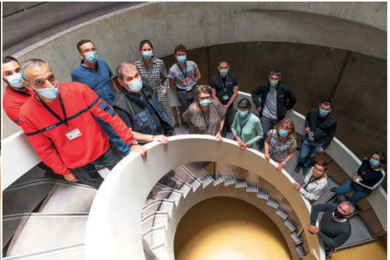
Une partie de l'équipe des agents de Lugdunum

Depuis la création du musée en 1975, les aspirations des visiteurs ont évolué.