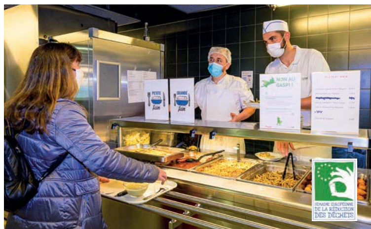
Animation anti-gaspi au restaurant administratif le 15 octobre dernier

➔ Infos à suivre sur Comète et dans la newsletter Trait d'union !